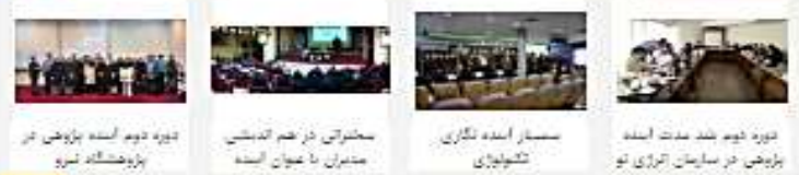
عنوان سخنرانی : ضرورت تکرار و مسئولیت‌های مدیریت