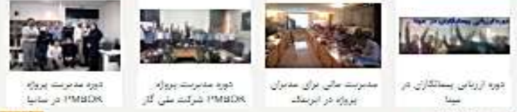
عنوان سخنرانی : ضرورت تکرار و مسئولیت‌های مدیریت