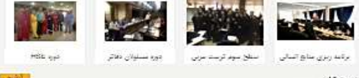
عنوان سخنرانی : ضرورت تکرار و مسئولیت‌های مدیریت