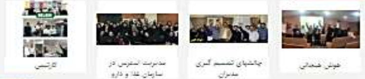
عنوان سخنرانی : ضرورت تکرار و مسئولیت‌های مدیریت