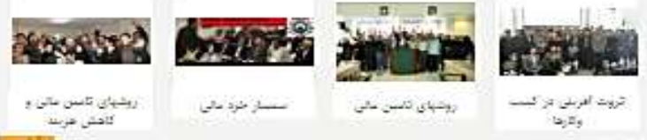
عنوان سخنرانی : ضرورت تکرار و مسئولیت‌های مدیریت